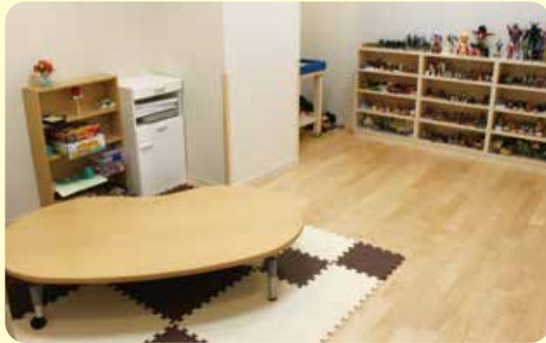
▲プレイセラピールーム

カウンセリングに関するご相談は お気軽にお問い合わせください。 TEL.0955-77-5120(外来)