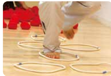
▲親子プレイントレーニング