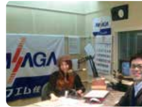
◀FM佐賀 「マインドビタミン」 毎週金曜日9:05頃放送中!

臨床心理士は、院内の仕事の他に、市の相談事業での市民の方向けのカウンセリングや、企業の社員向けの相談業務の実施、近隣の小・中・高校や企業に出向き、メンタルヘルス等に関する講演も行っていきます。 また、FM佐賀の「マインドビタミン」という番組では、当院心理士がパーソナリティを務め、リスナーの方の様々な悩みごとに対してお答えしています。