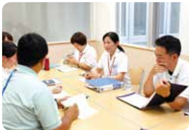
▲ストレスケア病棟ミーティング