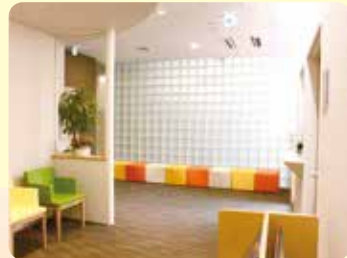
▲こどもの心外来 待合室