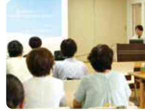
▲こころの講演「虹のつどい」 「発達障がいについて」の講師