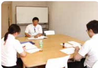
▲リワークプログラム ミーティング