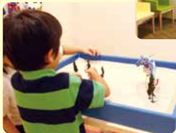
◀遊びを通してのこころのケア